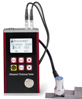
Ses hızının ölçülmesi