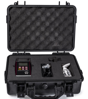
Su geçirmez Kutu